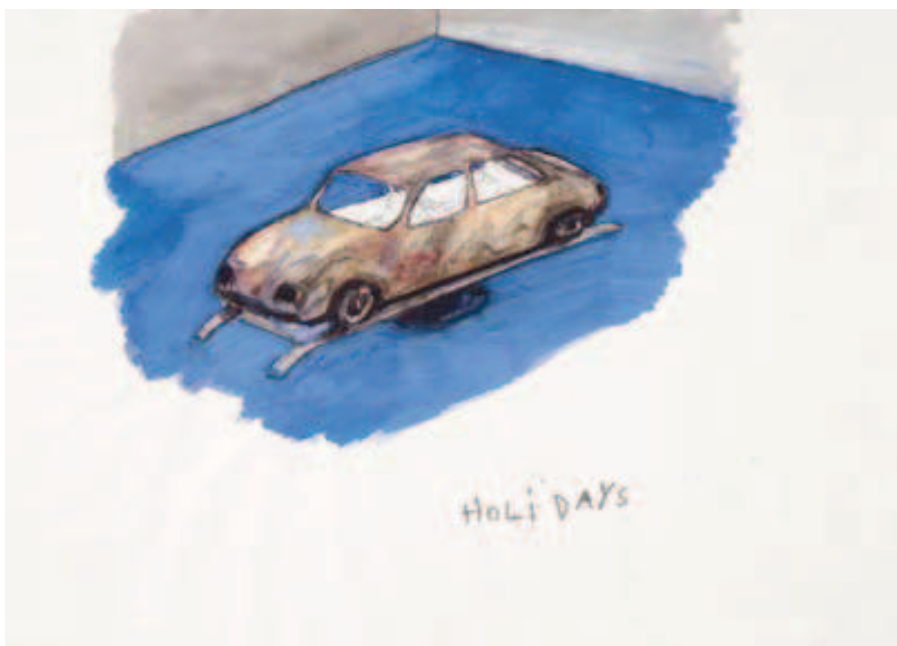
Holidays 1999 Aquarelle sur papier, 21 x 29,7 cm INV. 2008.1136 Don de la galerie Chez Valentin, Paris